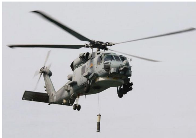
En US Navy MH-60R Seahawk med Thales' dyppesonarer

I 2019 besluttede det danske forsvar at opgradere forsvarets Seahawk MH-60R helikopter med dyppesonarer til ubådskrig, gennem udenlandsk militærsalg med den amerikanske regering. Dyppesonaren fremstilles af Thales under navnet FLASH, og Danmark skal opgradere syv helikoptere, der forventes leveret i 2024.