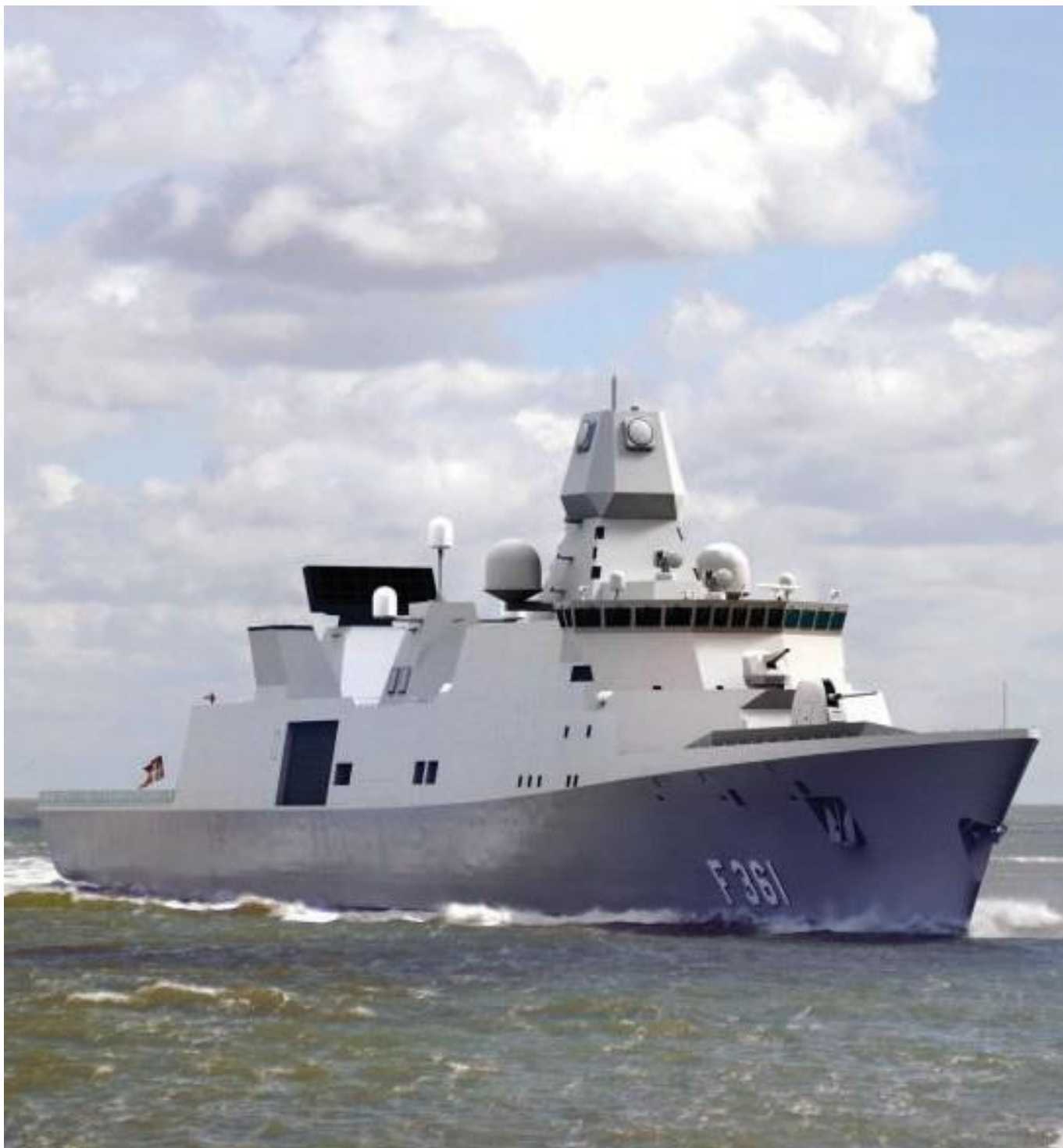
HMS Iver Huitfeldt med Thales APAR multifunktionsradar og Thales SMART-L langdistance radar

I dag beskæftiger Thales Denmark ApS 45 medarbejdere på hovedkontoret i Ballerup.