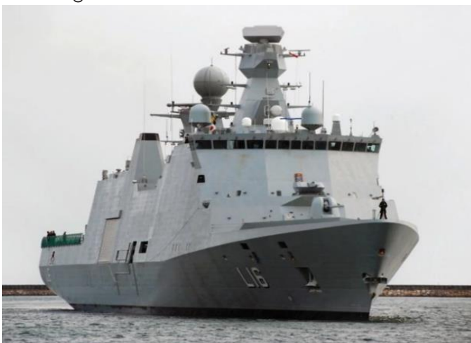
HMS Absalon med Thales' SMART-S Mk2 overvågnings radar

Da Thales værdsætter den høje kvalitet i dansk forskning, er det et hovedmål at rekruttere lokale medarbejdere og etablere et langsigtet samarbejde med danske universiteter og regionale forskningscentre. De markeder, vi tilstræber at adressere, ligger indenfor luftfartssikkerhed og forsvar samt sikkerhed og teknologi.